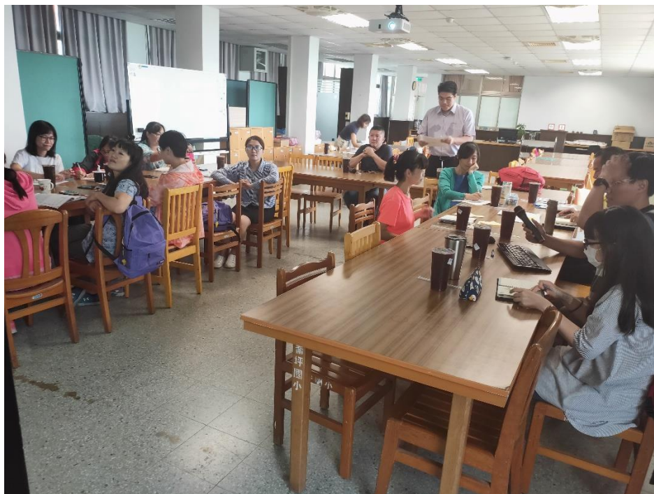
校長說明：如何因應新型冠狀病毒防疫各單位任務分工、 協調事項及防護措施